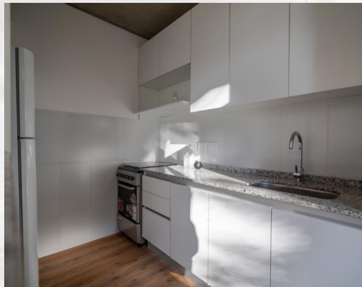
AÑELO NUEVO - UNIDAD MODELO