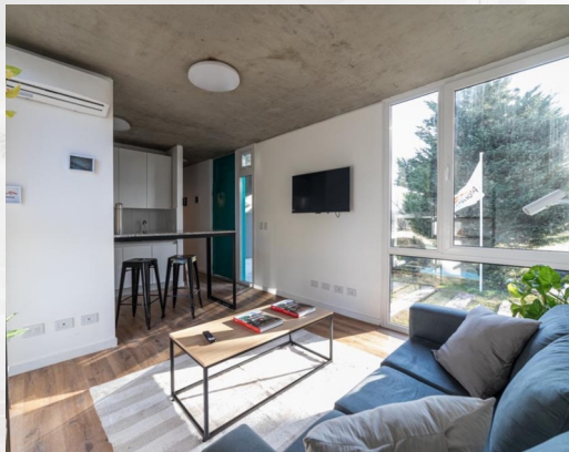
AÑELO NUEVO - UNIDAD MODELO